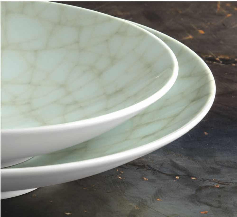
COUP Fine Dining »Growth«

On the other hand, the seemingly random surface pattern of »Reflections« emphasizes individuality and uniqueness. With highlights in rust optics, these decors blend perfectly with the modern »industrial style«.